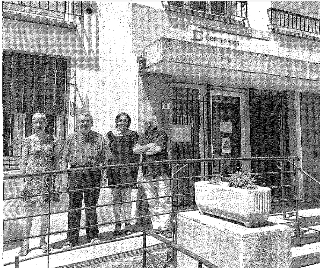
Les employés de la trésorerie (6 au total) seront affectés à d'autres sites comme Digne, Les Mées et bien entendu Sisteron où de nouveaux locaux ont été aménagés.