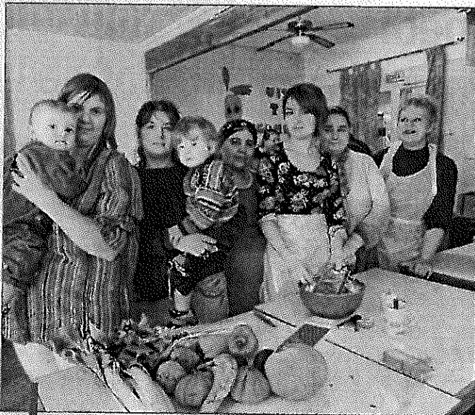
Les participantes sont fin prêtes à mettre la main à la pâte pour ces ateliers qui se déroulent tous les mercredis matin.

Des ateliers sont proposés tous les mercredis matins de 10h à 12h au Point Rencontre. Ouverts aux papas et aux mamans, les enfants y seront eux aussi accueillis et pourront s'initier à de nombreux jeux et pourquoi pas, mettre leurs petites mains dans certaines prépa-